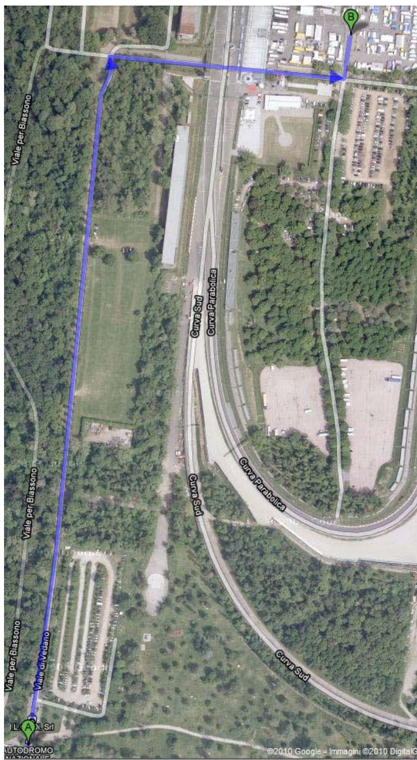
Figura 3 – dalla guardiola di accesso all’autodromo fino al Park riservato