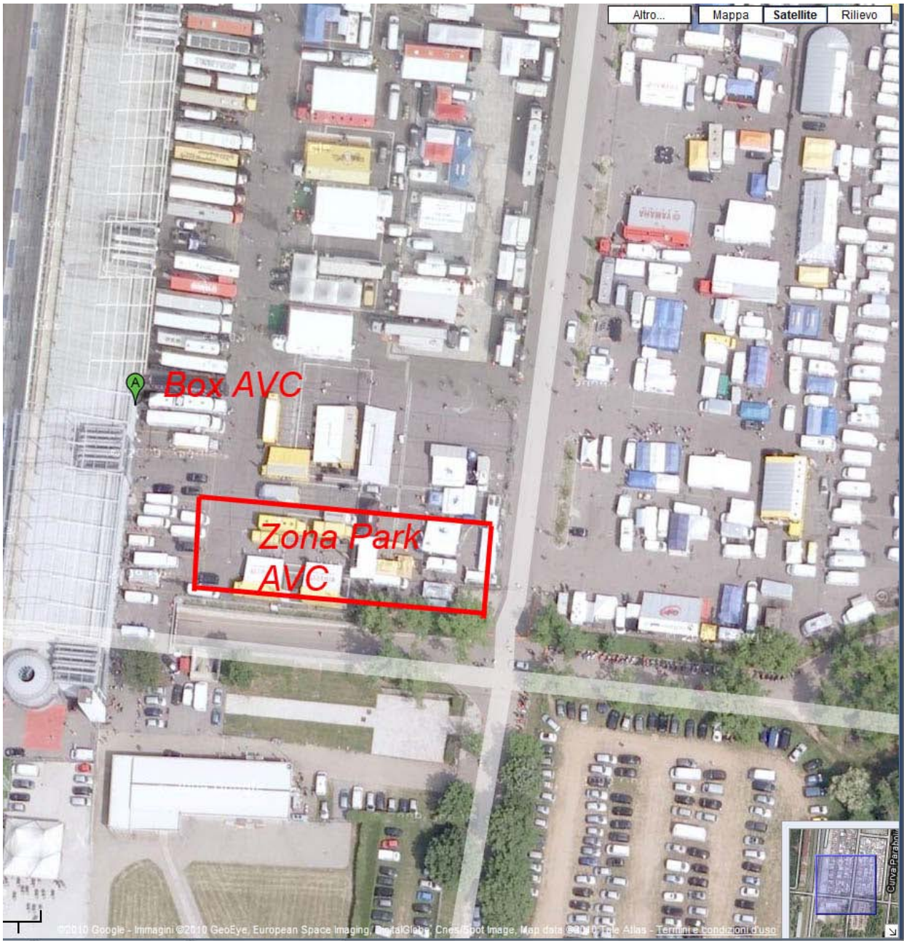
Figura 4 –zone principali di interesse