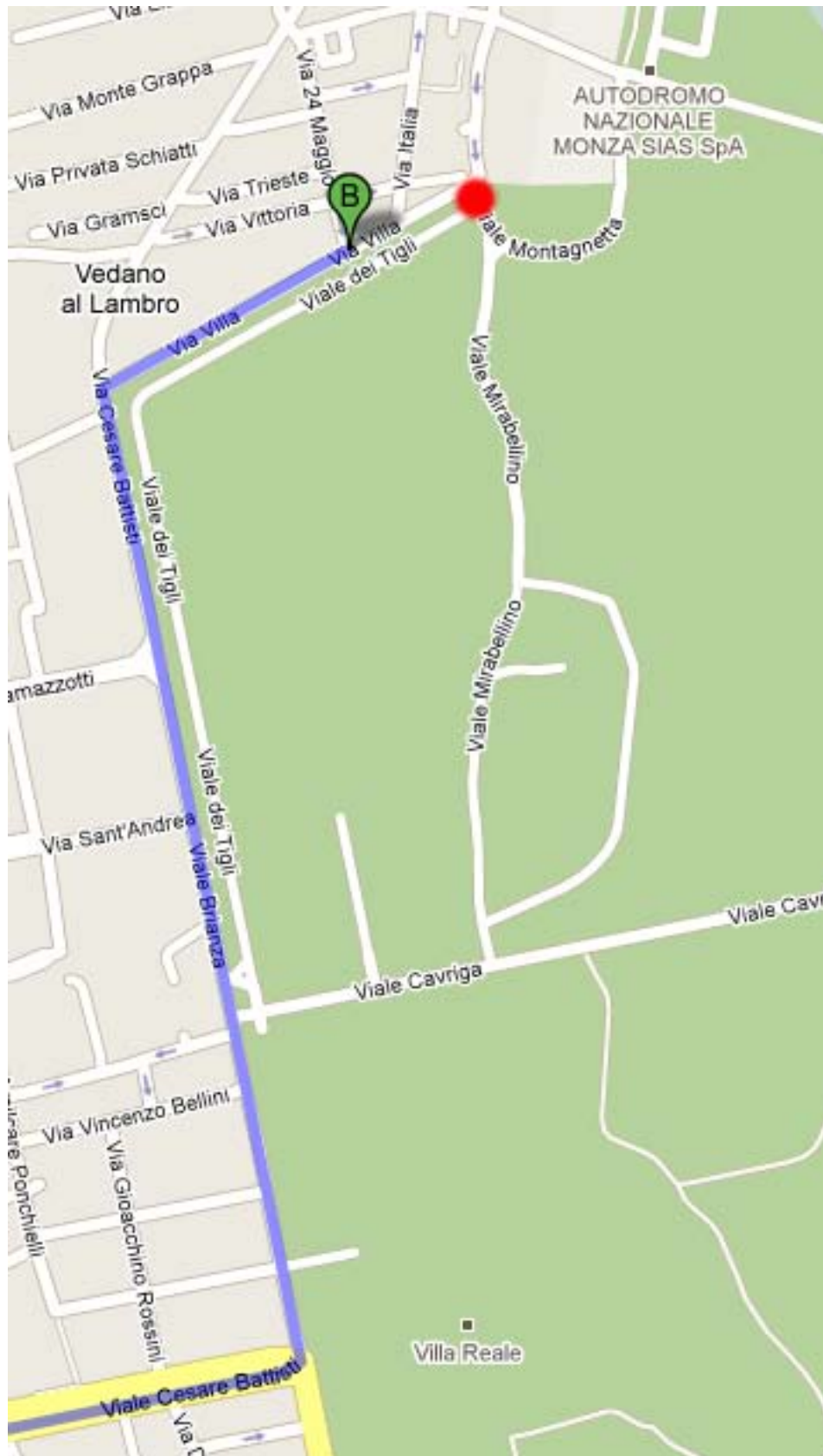
Figura 1 - Dalla Villa Reale fino all'ingresso dell'autodromo (in rosso in figura)